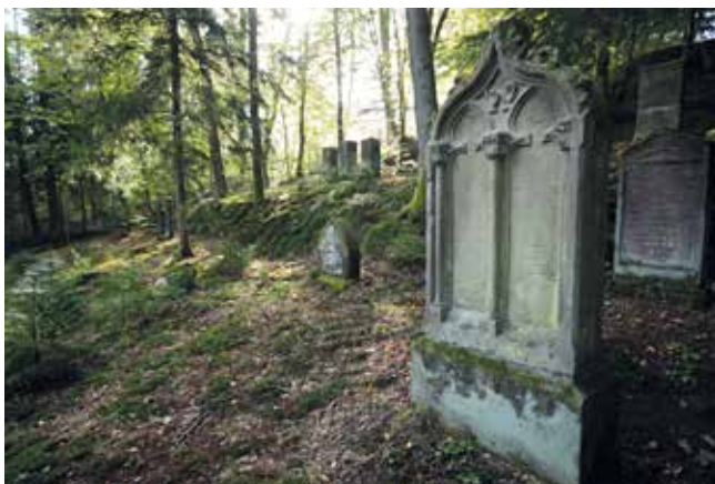
Jüdischer Friedhof Pirmasens

Veranstalter: VHS in Kooperation mit dem Altertumsverein Grünstadt